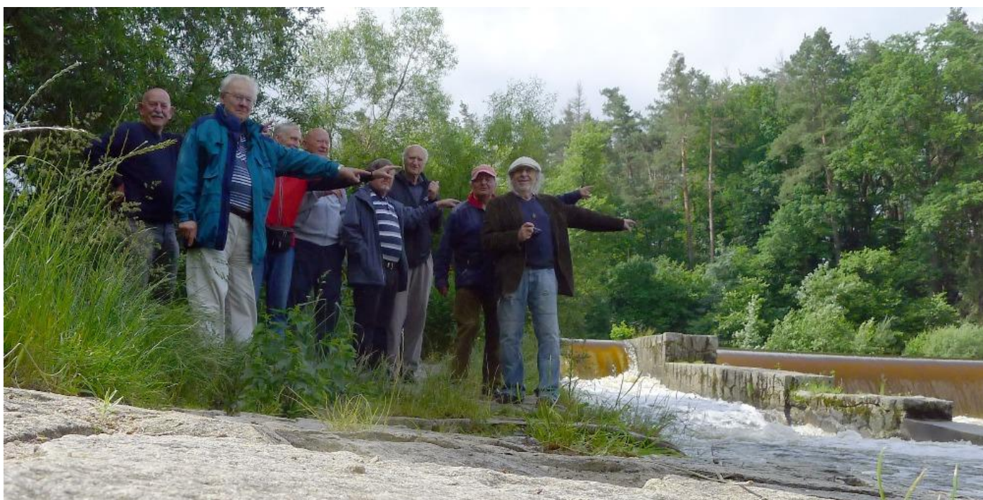
Tohohle, že bychom se měli bát?... My Pětkaři?! ....Ani náhodou!!!!