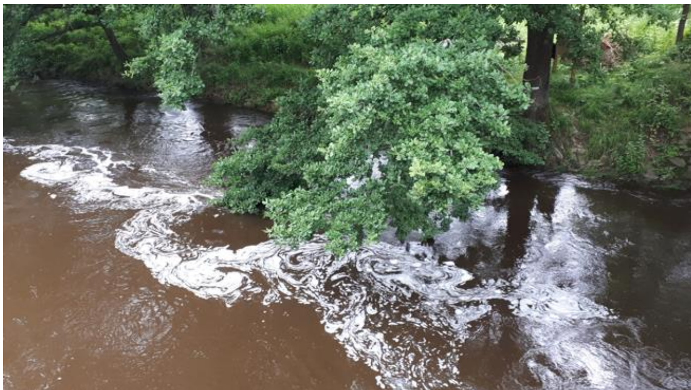
Přesto, turbulentní proud Nežárky plný vírů a plovoucích kmenů a větví nás lákal.