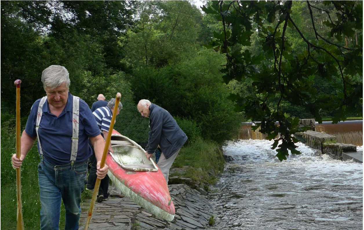
A tak jsme dali loď na vodu....