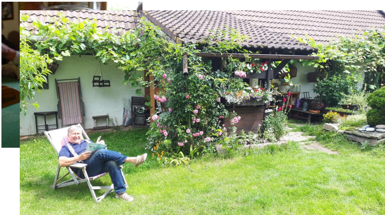
Mates před svou residencí

Zato jsme si neakci na schůzce vynahradili na Nežárce. Odvážná skupina dosud zdravých Prvostředečníků se ve středu 24. června vydala na riskantní plavbu po rozvodněné Nežárce. Po zprávách ve sdělovacích prostředcích, že se už v rozvodněných řekách utopilo 9 vodáků, včetně malých dětí, jsme se rozhodli, že nástrahy dravé řeky plné volně plujících kmenů a vírů pod spadnými stromy překonáme. K takovému výkonu je ovšem třeba se řádně posilnit. Proto jsme toto dobrodružství začali nejprve polévkou v chalupě u Matese v Hatíně. Tuto část dokumentují fotografie Přemíka , Chinga a Pacíka :