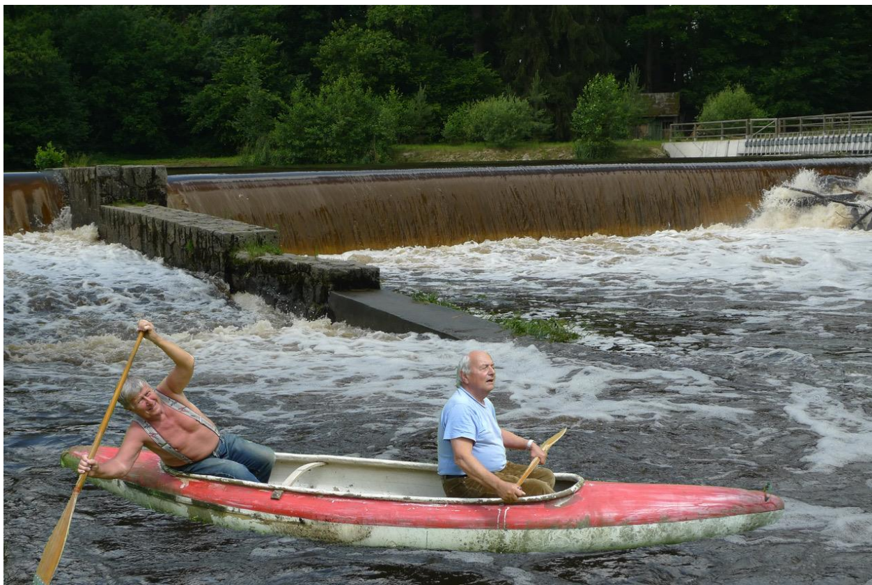
Mates s Pegasem byli rozumnější a bezpečně projeli šlajsnu pod Jemčinou